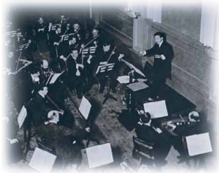
1918年 ニューヨーク・カーネギーホール

「この道」「からたちの花」など、美しい旋律を持った歌曲は教科書にも登場しているため、一般にも馴染みが深く、また指導者としても、日本の楽壇の向上に多大に貢献した。